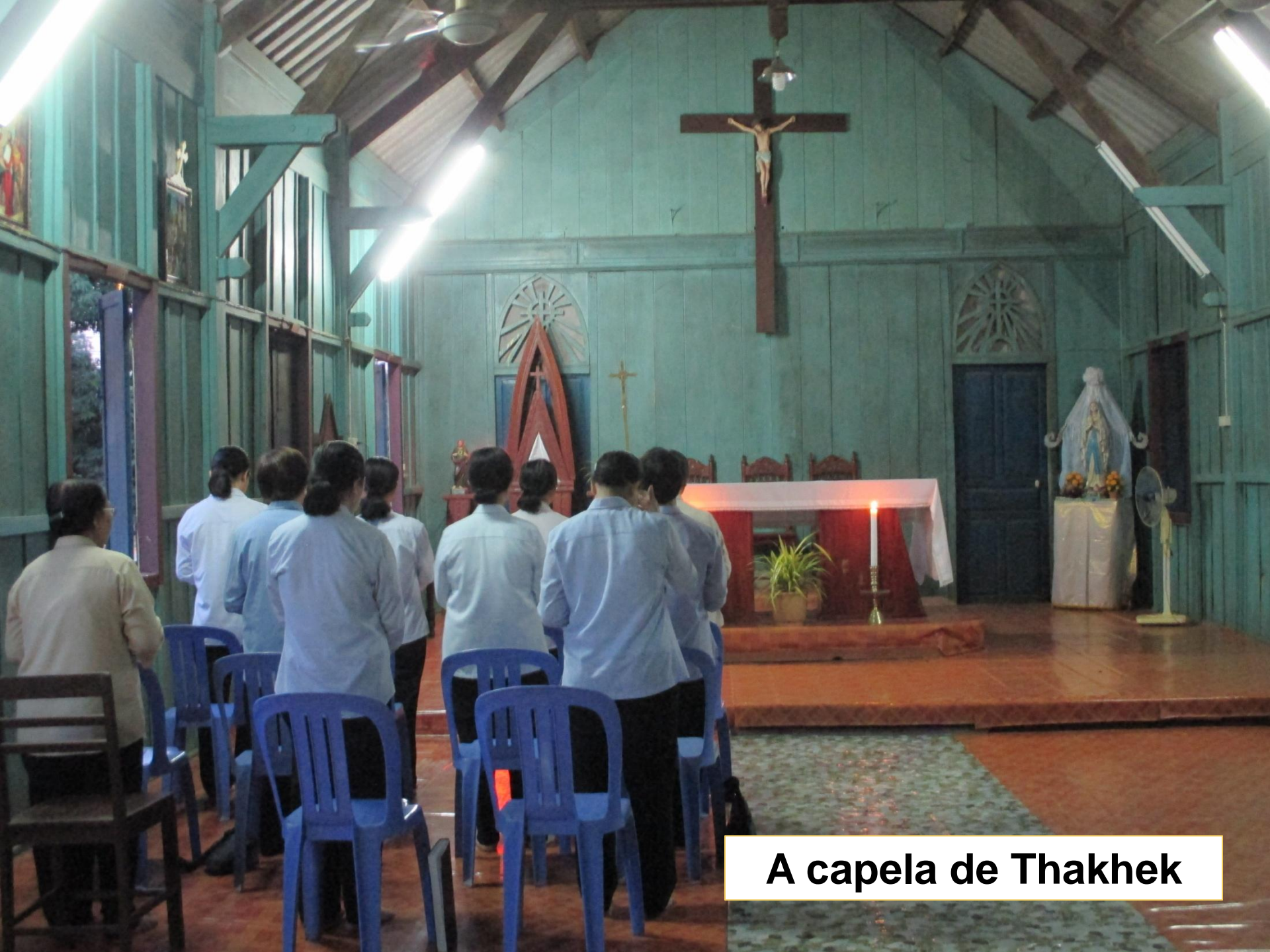
A capela de Thakhek